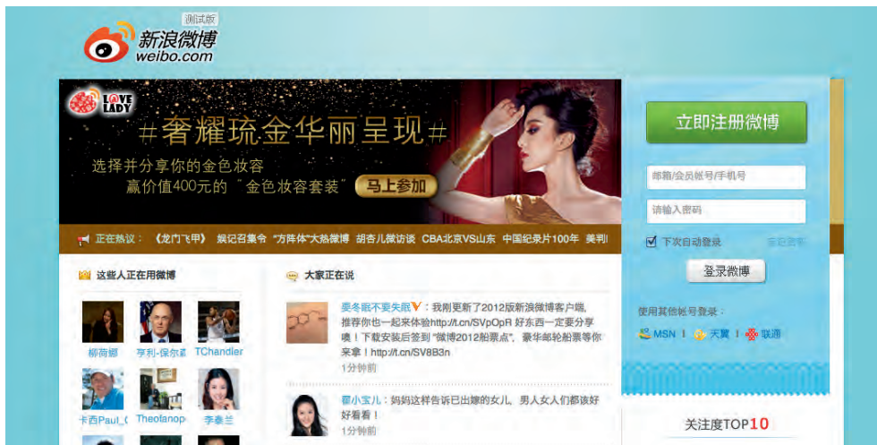
Fra weibo.com – det kinesiske Twitter.

verden, som fx Second Life, mod 0,4 timer i resten af verden. Endvidere bruger de unge mellem 18 og 27 år, som er i arbejde, gennemsnitlig 34 timer om ugen på kommunikation via e-mail, chat, blogs, sociale netværk, m.m. Her bruger man i resten af verden kun 11 timer. 21