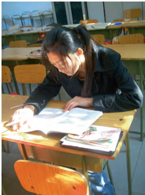
Pigen er elev på en NGO-skole ved Beijing, der hjælper unge kvinder fra landet til en uddannelse.

drene ikke dét, kan deres børn ikke få en god uddannelse og et godt betalt arbejde – og dermed penge til at forsørge deres forældre, når de bliver pensionister.