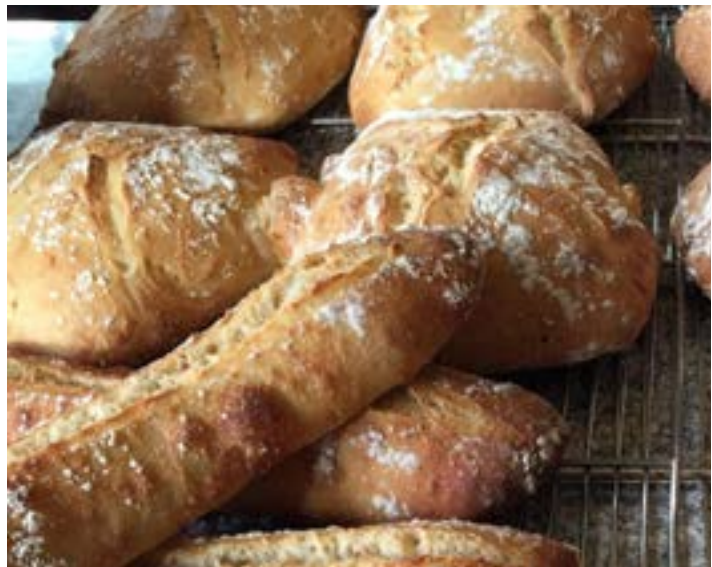
Foto: Il y a de différentes sortes de baguettes.