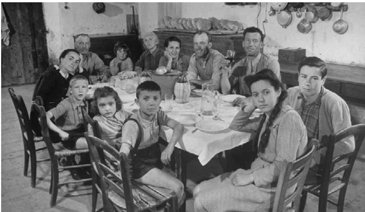
Famiglia toscana a metà del Novecento. (Alfred Eisenstaedt/The LIFE Picture Collection/Getty Images), Alfred Eisenstaedt https://www.wired.it/attualita/politica/2018/10/30/governo-misura-terra-chi-fa-figli

Beskriv billedet med fire sammenhængende sætninger på italiensk. Brug mindst 3 adjektiver og mindst et adverbium.