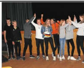
Glæden var til at få øje på, da Klarup Skoles 7. b vandt kagemænd til klassen og en biografbillet til hver elev.

Det er dejligt at arbejde sammen andre, der også kan noget tysk sagde en elev, der blev suppleret af en anden: - Jeg har nu bestemt mig for at tage tysk på A-niveau.