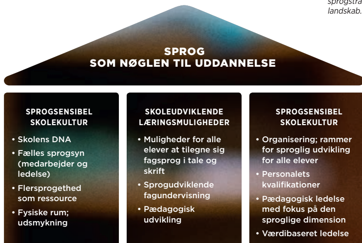
Fig. 1. Huset - mapping af det sprogstrategiske landskab.